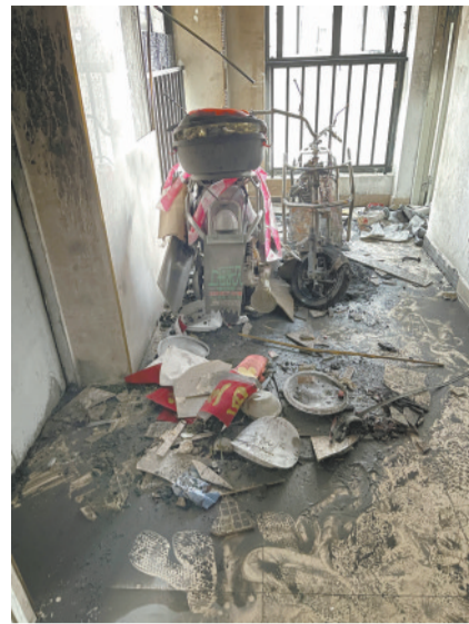
电梯间过道,两部电动车烧得只剩铁架

专家表示,若是业主将电动车推上楼充电发生火灾,将承担相关法律责任。电动车乘梯屡禁不止,不少市民呼吁有关部门加大处罚力度。