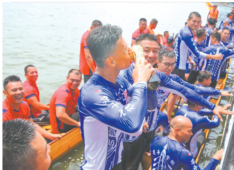
14日,福州高新区建平龙舟队勇夺福州传统龙舟赛三连冠