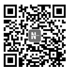
扫二维码,看《中国共产党党徽党旗条例》全文

识党徽党旗的深刻内涵和工作要求,自觉规范使用党徽党旗及其图案。中央组织部要会同有关部门加强督促指导,确保《条例》各项规定得到有效落实。各地区各部门在执行《条例》中的重要情况和建议,要及时报告党中央。