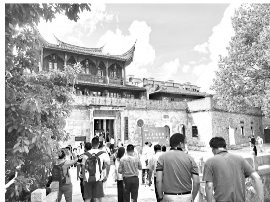
昨日,专家参观上下杭历史文化街区

海都讯(记者 唐明亮 马俊杰 见习记者 陈铃雪 文/图) 作为福州市历史中轴线和“三山两塔一条江”历史风貌特色的重要组成部分,上下杭素有“福州传统商业博物馆”的美称。昨日上午,记者跟随来自河北、河南等地的21位专家走进上下杭,从传统古建筑的斑驳点滴,感受有福之州浓浓的文化底色,从修缮保护和活化利用,感受“文化福州”的魅力底色。