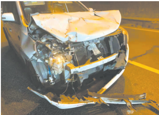
小车车头撞得面目全非

经民警调查认定,此次事故曾某负全部责任,其超载和违法载客行为,正在进一步调查处理中。