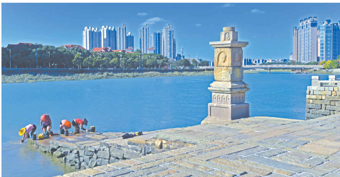
位于晋江北岸的江口码头,见证了泉州港的繁华历史

26日上午,国家文物局联合泉州市委、市政府在泉州海外交通博物馆举行新闻发布会,介绍泉州申遗的研究、保护、申遗、管理等情况。泉州将以申遗项目成功作为新起点,原真保护好、活态传承好、有效利用好泉州文化瑰宝。