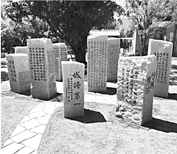
刻着历代冶山诗文的题刻

“片石横湖尚可扪,微风淡月见游魂。世间多少含情语,不及钟娘五字浑。” “虽然原来的石刻暂时