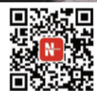
扫描二维码 下载“智慧海都”