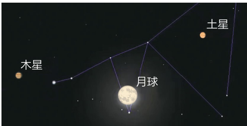
双星伴月示意图 唐昊制图

今天是农历七月十五,满月即将登场。晚上如果天气晴朗,市民仍可进行观测,欣赏满月戏双星一幕。