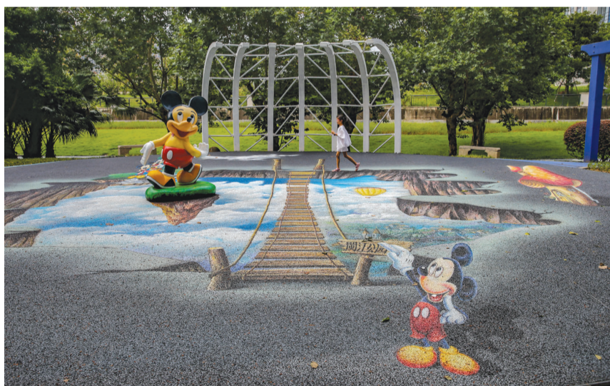
3D彩绘峡谷,让孩子们仿佛置身于“天空之城”

记者了解到,明月溪广场地面彩绘,是闽江公园改造提升工程的一部分。闽江公园管理处工作人员表示,他们希望通过彩绘的形式,给园区增加趣味性,让游客在散步、游玩时,能有更好的视觉体验感。