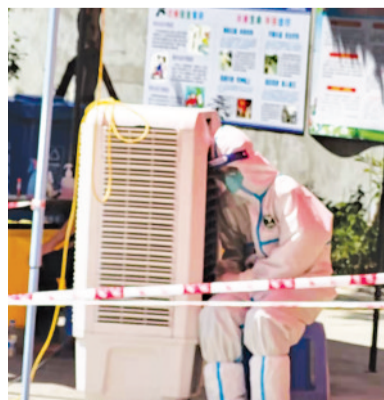
▲靠在空调外机上,打个盹