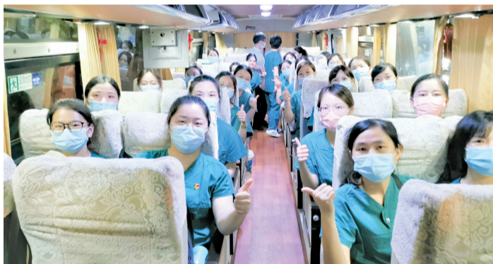
带着胜利的姿态出发