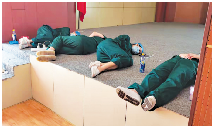
连夜工作,医护人员太累了,便席地而睡