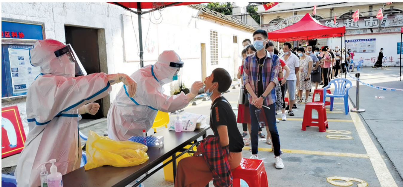
核酸采集现场,秩序井然

海都讯(记者 杨江参) 昨日,记者从南安获悉,因防控新冠肺炎疫情工作需要,南安多个景点即日起暂停开放,包括南安凤山寺、灵应寺风景旅游区、天柱山香草世界以及英良石文化创意园景区,恢复开放时间另行告知,请广大游客朋友及时调整行程。