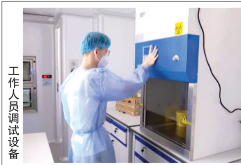
工作人员调试设备

当前,疫情仍在全球肆虐,人类社会已被深刻改变。世界进入新的动荡变革期。每一个负责的政治家都必须以信心、勇气、担当,回答时代课题,作出历史抉择。 一部世界文明史也是同瘟疫斗争的历史,人类总是在不断战胜挑战中实现更大发展和进步。这次疫情虽然来势凶猛,我们终将战而胜之。 我们要坚持对话而不对抗、包容而不排他,构建相互尊重、公平正义、合作共赢的新型国际关系,扩大利益汇合点,画出最大同心圆。 ——习近平在第七十六届联合国大会一般性辩论上的讲话 体系。只有一个秩序,就是以国际法为基础的国际秩序。只有一套规则,就是以联合国宪章宗旨和原则为基础的国际关系基本准则。联合国应该高举真正的多边主义旗帜,成为各国共同维护普遍安全、共同分享发展成果、共同掌握世界命运的核心平台。要致力于稳定国际秩序,提升广大发展中国家在国际事务中的代表性和发言权,在推动国际关系民主化和法治化方面走在前列。要平衡推进安全、发展、人权三大领域工作,把各方对多边主义的承诺落到实处。 习近平最后强调,世界又站在历史的十字路口。我坚信,人类和平发展进步的潮流不可阻挡。让我们坚定信心,携手应对全球性威胁和挑战,推动构建人类命运共同体,共同建设更加美好的世界!