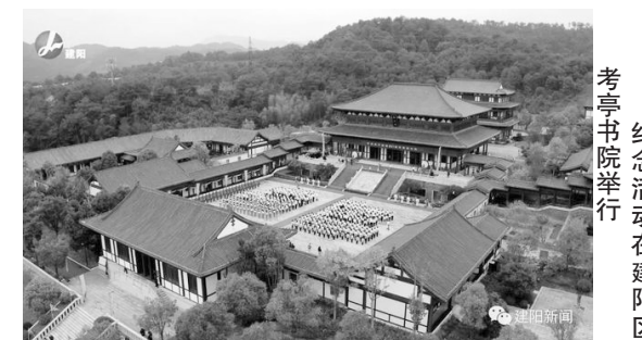
纪念活动在建阳区考亭书院举行

朱子是继孔子之后中国思想文化史上又一座高峰,朱子文化是中华优秀传统文化的重要组成部分。南平市建阳区是朱子晚年