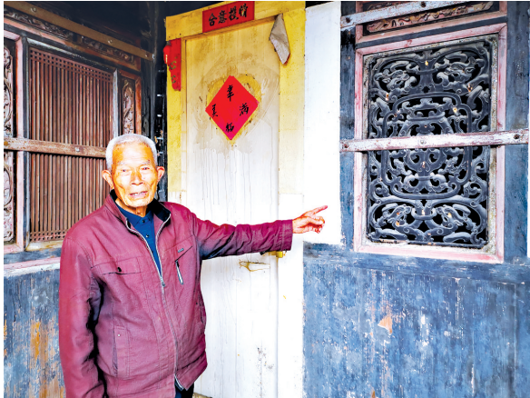
这里就是孕育余光中的地方