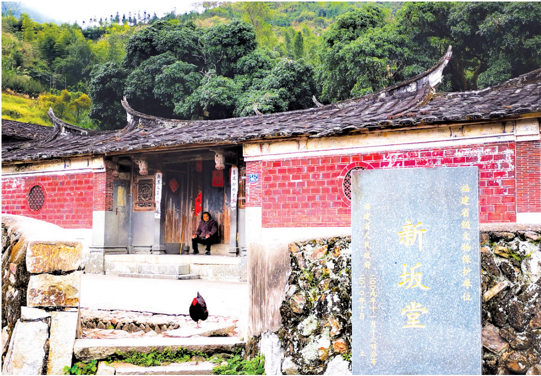
新坂堂已有百年历史,是余老乡愁记忆的起点