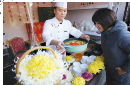
游客观看用菊花做的美食

北京市平谷区“菊花小镇”大兴庄镇是全国最大的食用菊生产基地,当地从2009年开始发展食用菊花产业,种植了10余个品种的食用菊花。品菊宴、看画展、住民宿、逛市集,每年举办的菊花美食文化节让这里成为京津冀民众的“网红打卡地”。