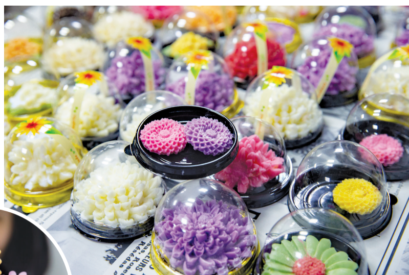
菊花巧克力造型不同,口味多样

未来,西湖公园以菊花为元素的文创产品将越来越多。据介绍,为让市民全方位感受福州西湖的菊花文化,工作人员还尝试制作了软木画菊花、七彩菊花、永生菊花等,其中,“一菊有七色”的七彩菊花是用特殊染料染色而成,已在今年金秋菊展上惊艳亮相,收获了无数爱菊人的好评。永生菊花又名“保鲜菊花”,需经过脱水、烘干、染色等一系列工序,才能达到“永不凋零”的效果。