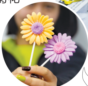
菊花造型的巧克力棒棒糖

60多年前,福州西湖举办了首届金秋菊展。如今,几代福州人都视赏菊为乐事,每年必来“打卡”。为了让市民百看不厌,菊展也不断地与时俱进,比如引进新品菊花、打造园林小品、展示特色金鱼等。11月11日,海都记者从福州市园林中心获悉,为进一步提升菊展的影响力,西湖公园将推出“可食菊花”,各种菊花造型、口味丰富的巧克力。接下来,越来越多结合菊花元素的文创产品,将陆续与市民见面。