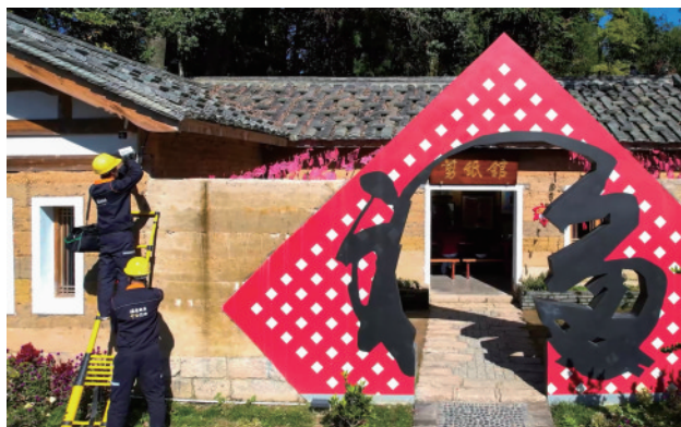
安装“平安乡村”摄像头

宁德市位于福建省东北部沿海,坐拥“山海川岛湖林洞”美景,独特的滩涂风光闻名全国,自然旅游资源丰富。近年来,伴随中国电信不断完善的信息通信网络,宁德市立足山海资源禀赋,统筹推进乡村振兴战略,积极拓展智慧乡村、智慧旅游等信息化平台,助力农民做电商、开民宿,提升闽东农村治理能力和公共服务水平,在绿水青山中找到了“金山银山”。