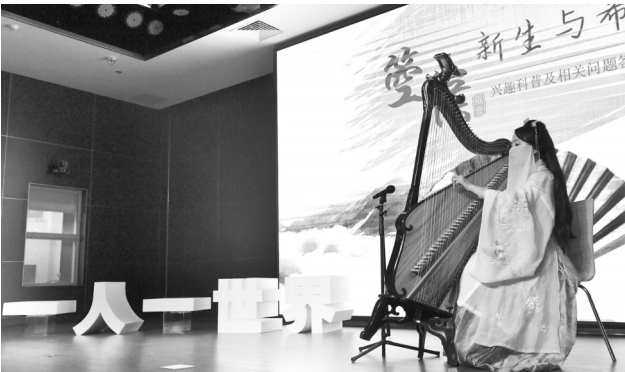
罗爱分享她与箜篌的故事

“一人一世界”的舞台,邀请过福建教育界的泰斗,还有年逾古稀的福州评话大师,登上过TED演讲台的“90后”青年,只身前往非洲创业的福清女孩……他们分享各自的故事,让这里的观众像打开一个“任意门”,便可以通往另一个世界。