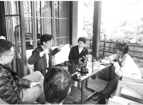
“一人一世界”活动前的策划会

作为福州本土一档有内容有温度的城市人文沙龙,福州市图书馆“一人一世界”用将近4年的时间,邀请100多位分享者,通过每人18分钟的演讲,让更多的人了解了福州这个城市背后许多不为人知的人文故事。在活动发起者的眼中,每位分享者都是这个活动的策划者,他们让这个舞台越来越丰富而深厚,也使得“一人一世界”越来越成为一部让人不忍释卷的有声作品。