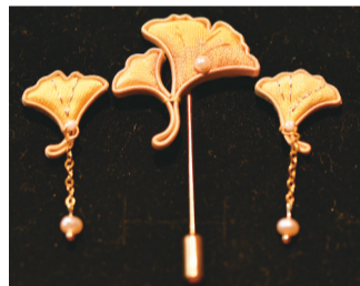
盘扣耳钉饰品“三生有幸(杏)”,受到年轻情侣的喜爱