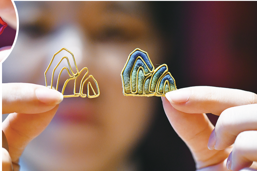
相比软盘扣,硬盘扣更易设计造型