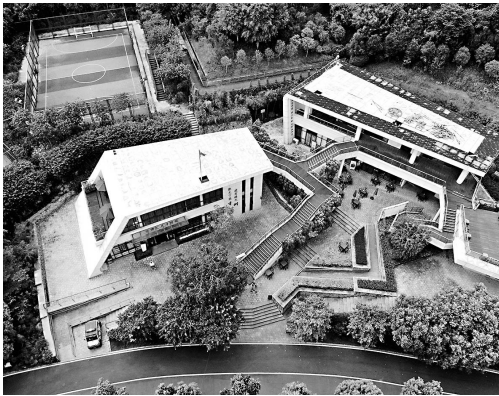
图书馆分为上下两层

这座主题为“榕荫·书情”的福州市少年儿童图书馆牛岗山人才主题分馆,也是福州市首家无人值守智能化城市书房。18日下午,海都记者来到这座温馨书房,探寻智能化书房背后的故事。