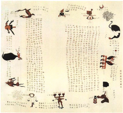
战国楚帛书(摹本),为现存最早插图

古人不仅为书绘制插图,还用画笔记录当下、追忆往昔,甚至用画传递重要情报,比如那幅著名的《韩熙载夜宴图》的背后,就藏着一段生死沉浮的往事。而在没有相机的时代,古人的画像也有“一键美颜”的功能。早在一百多年前,慈禧就已深谙修图美颜的重要性了。今天的《史话》就来看看古画里的隐秘记忆。