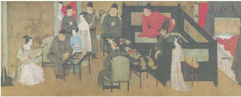
《韩熙载夜宴图》局部(宋摹本) 现藏于故宫博物院

清初插画水平不逊于明,可自雍正后,插图质量却陡降,大部分书籍甚至无插图。直到19世纪30年代初,西洋传教士舶入石印技术,才略转颓势。