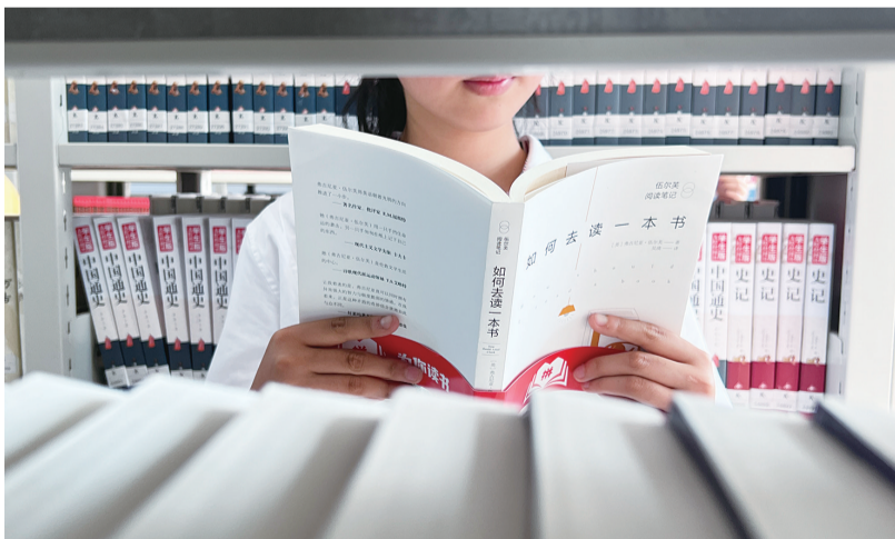
“为你读书”公益行动走进野三关镇初级中学,为2000多名学子送来7000多册精选的图书

记者了解到,在一年多的时间里,拼多多“为你读书”公益捐赠行动持续走进中国最偏远的高原、山区、乡村,为中小学校的孩子们捐赠图书近30万册,并邀请国内知名作家、学者,和孩子们一起读书。