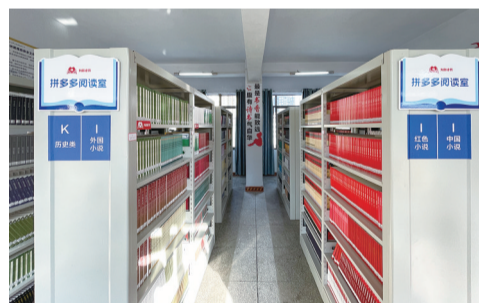
学校已将捐赠图书全部分类、上架,预计周内向全校师生开放

行补充,图书总量有所增加,但已不能很好地满足师生好读书、读好书的阅读需求,因此借阅室的利用率不高。此次“为你读书”捐赠的图书都是最新的出版版本,内容丰富,校方希望用好这批书,让更多的学生多多读书、多多受益,感受阅读的力量。