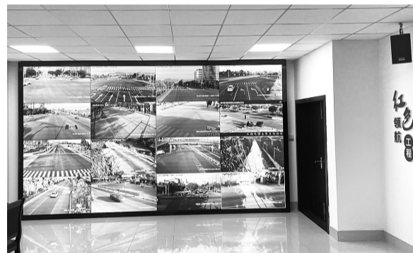
监管平台监控画面

为进一步完善“两违”网格化动态巡查机制,简化快速查处流程,高效严控新增“两违”,整个违建处置流程分为发现报告、快速认定、拆除整治、监督检查、效能问责五个流程。五个处置流程对应了五名角色,分别为巡查人员、认定人员、拆除人员、监督人员、问责人员。