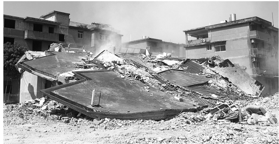
拆除一处违法建筑

“职责清晰,每一个处置环节确认了具体责任人。”相关负责人介绍,在快速处置中,从疑似“两违”的发现到整治完成时限为7天。每天未发现疑似“两违”的要进行打卡,确保巡查人员到岗到位,实现零报告制度。为有效扼制新增,减少资源损失,