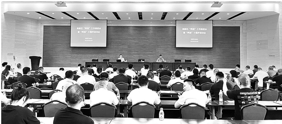
200多人参加微信小程序培训

今年以来,高新区在整治违法建设方面持续发力,做了大量工作,也取得阶段性成效。截至目前,完成拆除“两违”面积14.22万㎡。其中,南屿镇拆除“两违”面积5.81万㎡,村镇办拆除“两违”面积8.41万㎡。