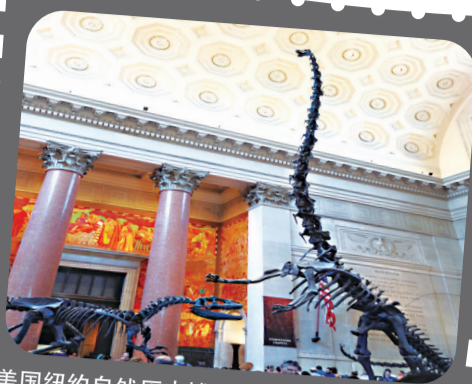
美国纽约自然历史博物馆展出的恐龙骨架

受到疫情防控的影响,中秋、国庆期间,很多人选择就地过节,我们推荐十部以博物馆为背景的电影,让大家趁着难得的假期,一起感受博物馆里的光影故事。