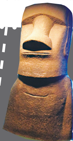
在电影中会嚼口香糖、吐泡泡的复活节岛石像