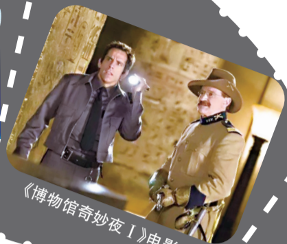
《博物馆奇妙夜 I》电影剧照