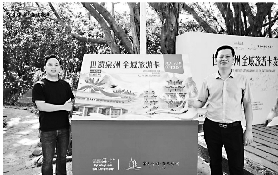
旅游卡集吃住行游购娱于一体