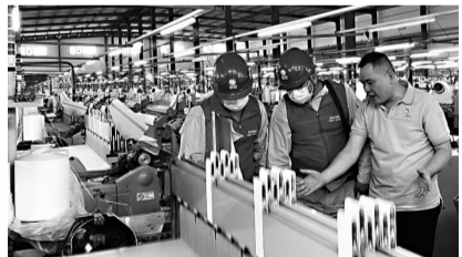
国网福建电力“双满意”共产党员服务队讲解用电优化建议

据悉,国网泉州供电公司“电e金服”嵌入百千万客户大走访中,制定“一企一策”多元化融资方案,助力企业复工复产。截至目前,泉州供电公司“电e金服”落地金额达5.78亿元,为企业注入金融“活水”。