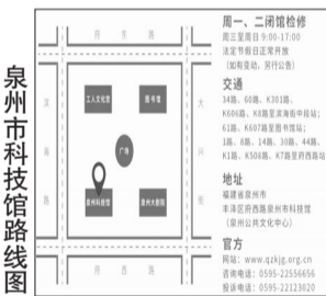
泉州市科技馆路线图

据考古发现,贺兰山岩画距今已有3000年~10000年的历史。在宁夏,近6000幅神秘诡异的岩画,被刻印在贺兰山贺兰口峡谷两侧延绵800多米的山岩崖壁上,它生动记录了远古游牧民族放牧、祭祀、狩猎、征战、生产、生活等各种场景,是研究人类文化史、宗教史、原始艺术史的文化宝库。