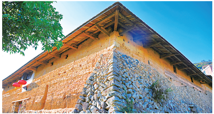
泥土和山石的结合,透露着古人的智慧

泉州警方提示:各地渣土运输企业要深刻吸取事故教训,进一步落实企业安全生产主体责任,健全并严格落实公司各项安全生产规章制度,要加强对驾驶员的安全生产教育和培训,如实记录驾驶员的安全生产教育和培训时间等,对驾驶员的违法驾驶行为要及时进行针对性的惩戒和教育培训;要进一步强化渣土运输车辆动态管理,对所属车辆要及时纳入工程运输车安全监管平台进行管理,发挥平台报警提醒功能,及时纠正驾驶员不安全行为;要加强交通事故应急预案演练,提升交通事故应急处置能力和水平。