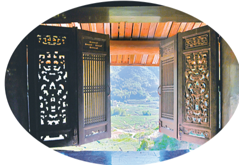
古朴的窗户与窗外美景相映成趣