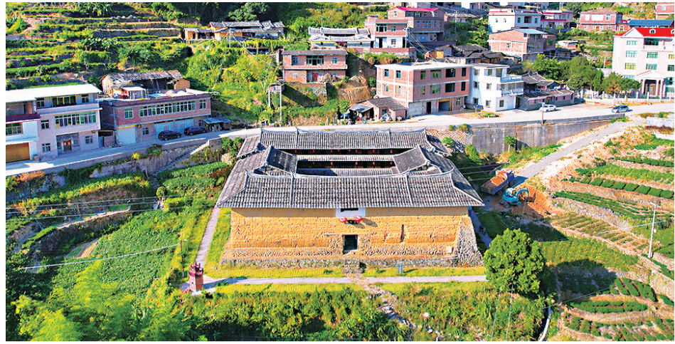
六百多岁的聚斯楼,静静地伫立在阳光中