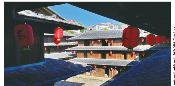
三层建筑古香古色

土楼里处处都透露着古人的智慧。一楼的每个房间都设有木梯通往二楼,各家保持独立,又相互依