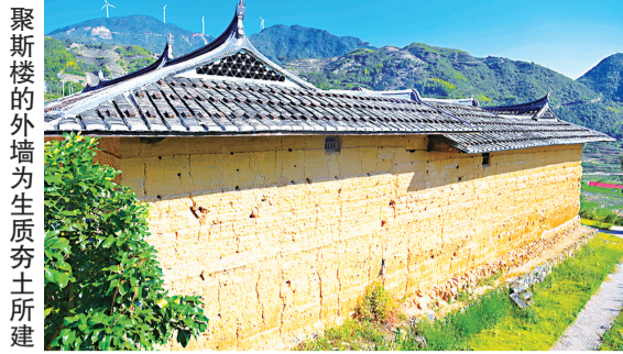
聚斯楼的外墙为生质夯土所建