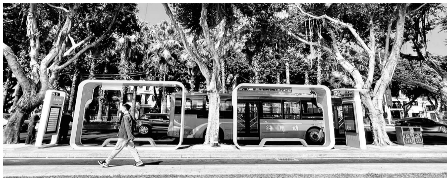
青年广场公交车站以“青春相册”为主题

福州第一座精品公交站亮相青年广场;道运部门表示,接下来还将建设更多精品公交站,打造成城市窗口