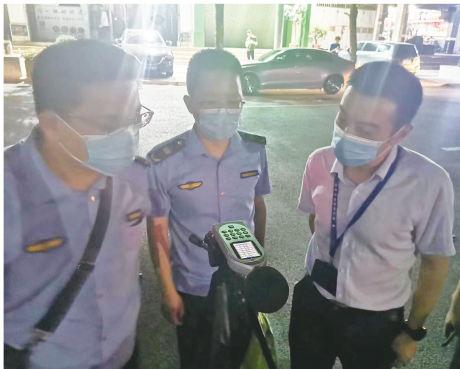
工作人员在现场检测噪声

自9月9日全省开展“静夜守护 噪声治理 我们在行动”专项攻坚行动以来,泉州市生态环境、公安、住建、交通运输、城管、文旅及市场监管等部门紧扣重点,迅速行动,持续有力推进了全市“静夜守护”城市夜间噪声污染整治。据统计,9月9日以来,市县两级各部门共计出动执法人员27103人次,检查噪声点位9765家次,及时制止化解涉噪声问题805个,为泉州市民守护一个又一个静夜。