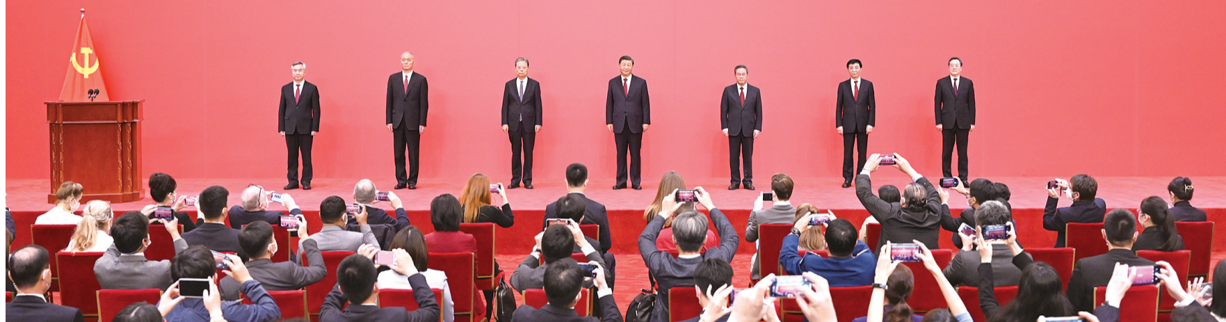
中共中央总书记习近平和中共中央政治局常委李强、赵乐际、王沪宁、蔡奇、丁薛祥、李希在北京人民大会堂同中外记者亲切见面

Meeting between Members of the Standing Committee of the Political Bureau of the 20th CPC Central Committee and Chinese and Foreign Journalists