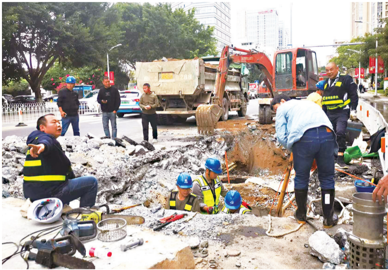
工作人员正在进行抢修

11月1日傍晚6时多,泉州市区宝洲路与刺桐路口,一条通往东海、台商投资区方向的自来水主管道爆裂,造成多地突发性停水,同时该路段交通也受到了影响。 而9月16日,泉州北峰段湖路也发生了一起较为严重的供水管爆裂事故,造成较大面积停水,并有数十辆汽车、电动车被淹泡损坏。不少网友在“智慧海都”APP留言,询问发生这种情况,自来水公司如何应急供水?如果发生财产损失由谁赔偿?泉州市区目前自来水管网是不是已经老化严重?对此,海都记者进行了调查采访。