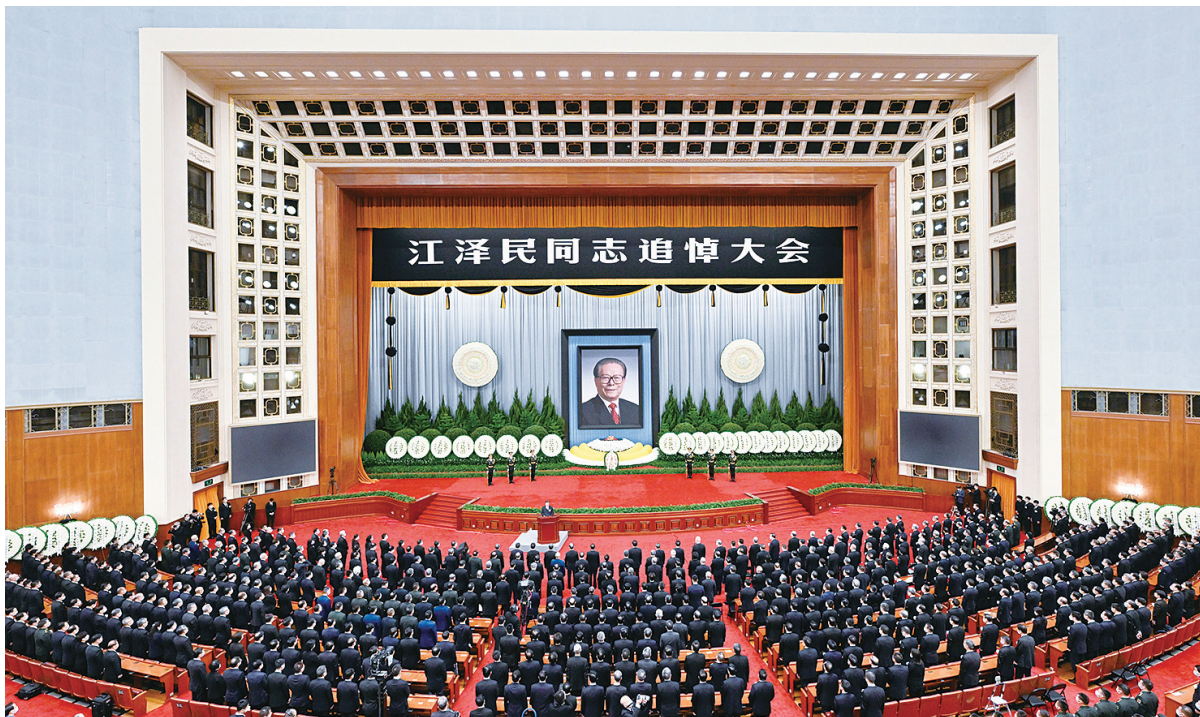
12月6日,中共中央、全国人大常委会、国务院、全国政协、中央军委在北京人民大会堂隆重举行江泽民同志追悼大会

丰功伟绩。他指出,从党的十三届四中全会到党的十六大的13年中,国际形势风云变幻,我国改革开放和社会主义现代化建设进程波澜壮阔。在国际国内十分复杂的形势下,江泽民同志带领党中央领导集体,高举马克思列宁主义、毛泽东思想、邓小平理论伟大旗帜,坚持党的基本路线不动摇,紧紧依靠全党全军全国各族人民,坚定不移坚持和