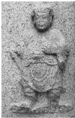
墙上石雕古朴生动

石楼一、二层没有窗门,只有三层有。三层上的糯米糖水灰墙壁,四面各设有三个大小不一的窗门,可以做射击枪孔,这些都是三重窗,也可以防火。沿着石砌的台阶,记者一步步走上三层,穿过走廊,走进碉堡,里面的空间可容得下四个人,射击孔里大外小,里面的人可以射击来犯的强盗,而外面射击的子弹很难伤到里面的人。