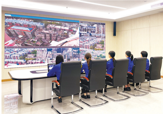
鼓楼区城市管理指挥中心

目前,在“技防+人防”的高压管控模式下,全市新增“两违”得到有效遏制,今年全市共计查处新增“两违”707宗,拆除建筑面积11.95万平方米。