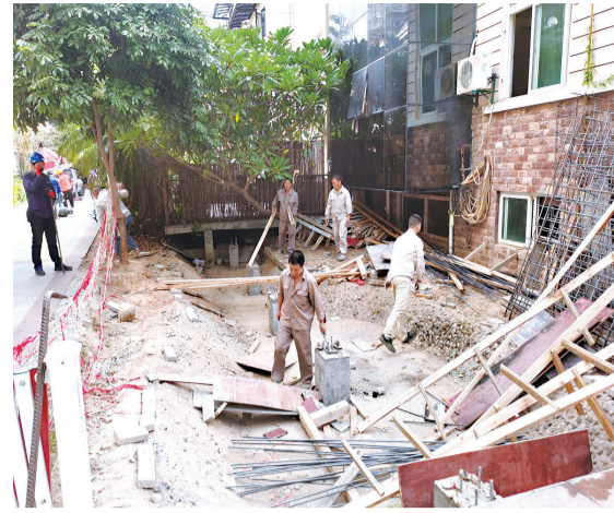
晋安区一小区业主违建被立即拆除