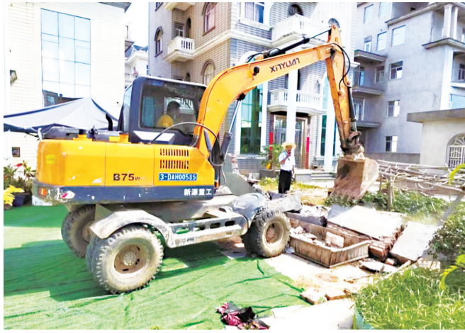
江镜镇南宵村违建墙被拆除

顶楼违建、私搭铁皮……这些违法行为,虽“赢”得一时之“方便”,但可能也埋下了更大的安全隐患。 近年来,福州探索新形式、新方法等举措开展违法建设治理工作,以“一拆到底”的决心,对违建“零容忍”的态度,发现一起、拆除一起。今年,为重拳刹“两违”,福州还以“人防+技防”的科技控违手段,让查违“无死角”,使新增违法建设得到有效遏制。