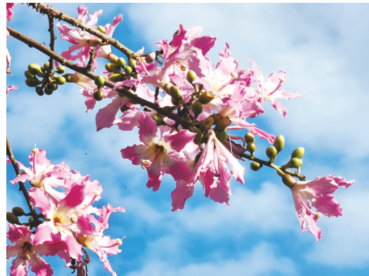
蓝天白云下,美人树粉色的花朵格外娇艳