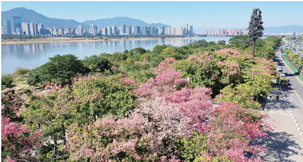
乌龙江湿地公园,美人树灿若霞云

有趣的是,虽然美丽异木棉的花朵娇艳动人,但它的树干上却长满了可怕的尖刺,仿佛“拒人于千里之外”。园林专家介绍,美丽异木棉的这一特征与带刺玫瑰一样,是一种自我保护,可防止草食动物啃食。