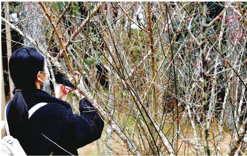
最早一波盛开的 鼓岭的樱花是福州