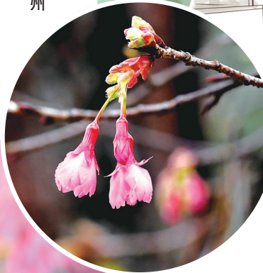
倒挂的“金钟” 山樱花酷似