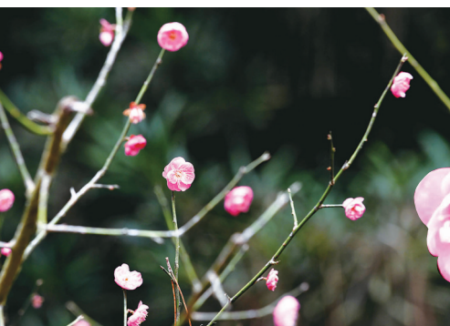
鼓岭的梅花开得比市区早