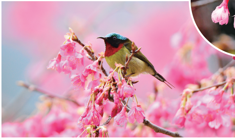
福州国家森林公园,山 樱花和太阳鸟同框(资料图)