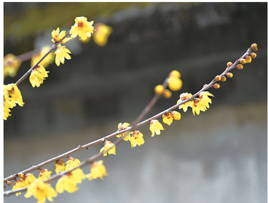
林阳寺的蜡梅在枝头逐渐绽放