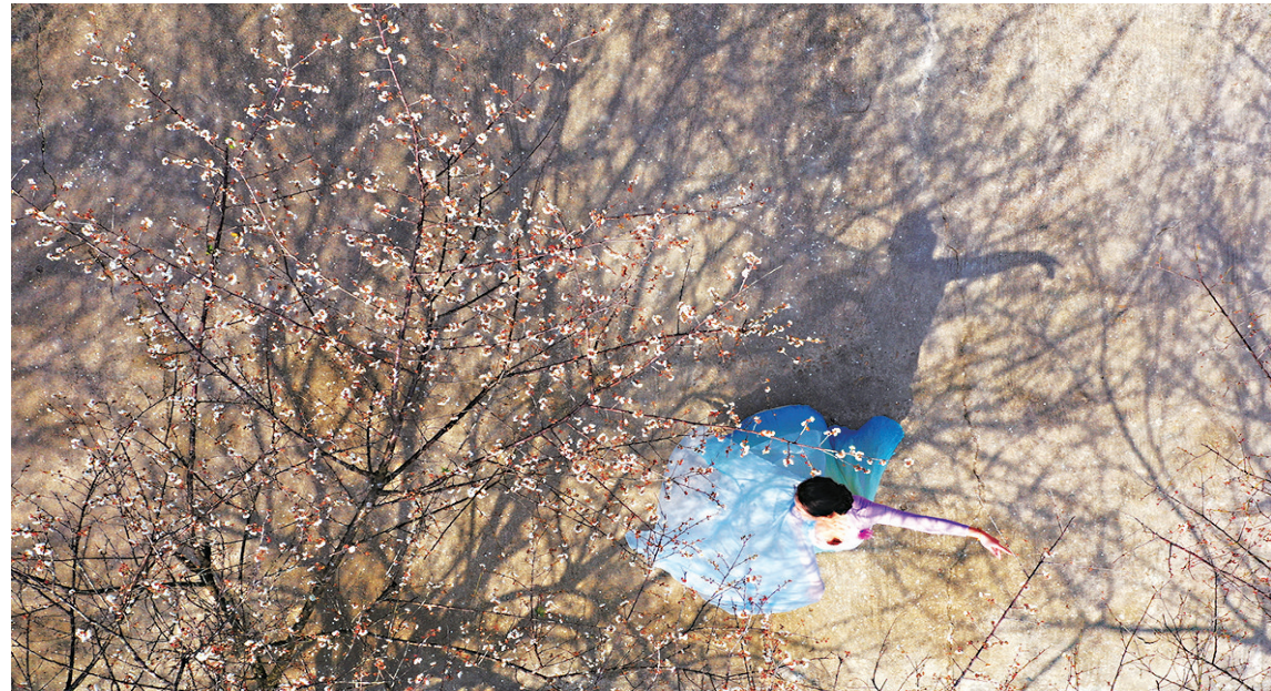
梅花暗香浮动,树下美人起舞