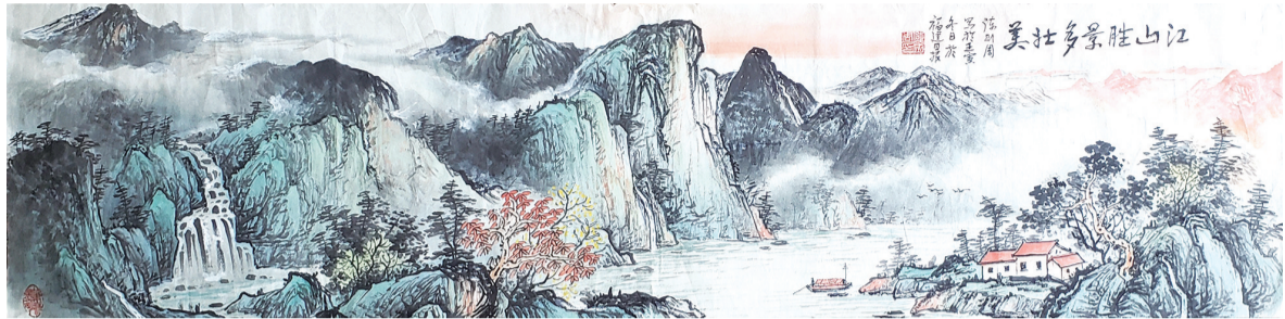
江山胜景多壮美(国画)陈则周