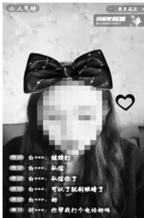
直播间内,主播提供代打电话服务

想买国外商品,可以找人代购;喝了酒不能开车,可以叫个代驾……不知不觉中,“代经济”悄然兴起。最近,网络上又掀起了一波“代打电话”的热潮——只需关注主播并在直播间刷礼物或是以私信转账的方式,便可让主播为其“传话”,以电话形式进行表白、祝福、测试、整蛊等。律师表示,代打电话是基于商业目的或个人目的处理个人信息,是违法行为。