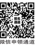
微信扫码申领通道

缺牙该怎么办?种植牙要花多少钱?缺牙市民拨打400-0591-560热线提问,到院即可领取品牌食用油1份,就诊再领以下好礼!