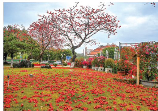
泉州临漳门,地上被雨水打落的木棉花好似铺了层红毯