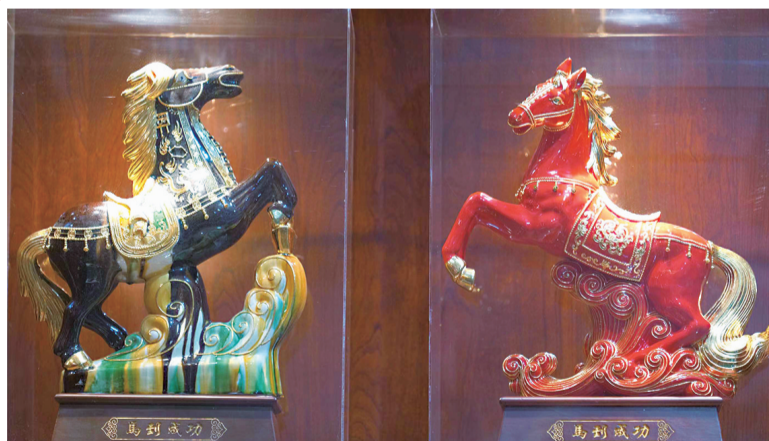
漆线雕做工精细雅致,形象生动逼真