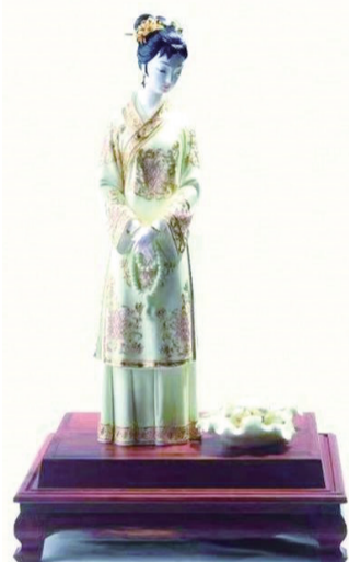
获奖作品《荷花女神》