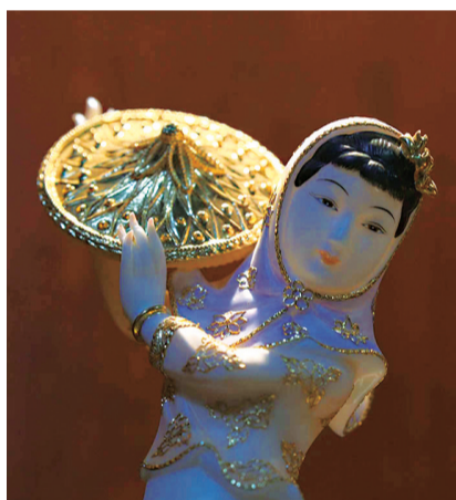
她的作品具有浓厚地方特色