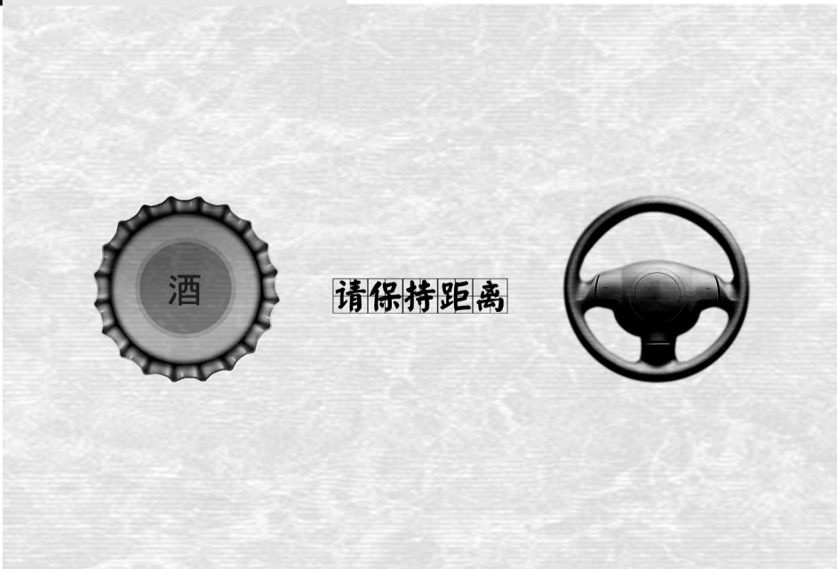
安徽省安庆市晚草小生动漫工作室 制作