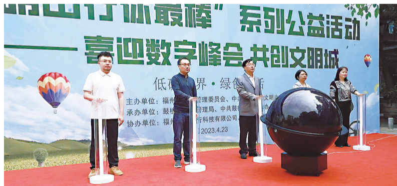
福州正式启动“文明出行你最棒”主题系列公益活动

结合物联网、大数据、人工智能和北斗技术等数字技术,实时监测每辆单车的运营情况,将其打造成移动物联网平台,对共享单车进行高效运营管理。应用“蓝牙道钉”技术,结合“路面共享单车停放负面清单”来规范共享单车停放秩序。通过高精度识别提示和违停扣费,对存在违规停放共享单车等不文明行为的用户实行积分制管理,以引导市民规范停车。同时为了方便市民骑行共享单车,福州市城管委在各大地铁口设立了共享单车专用停车位,并要求共享单车企业在地