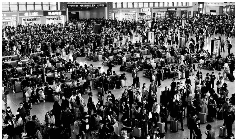
昨日,福州火车站候车厅坐满了乘客

针对大客流密集出行,福州火车站实行网格化管理,按照旅客乘车车次、时间,实行分区域候车、错峰交叉进站管理,车站组建党员突击队、机关干部志愿服务队、团员青年志愿服务队,在进出站口、电梯口、候车室等客流