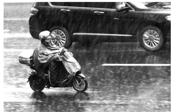
福州昨日出现降雨