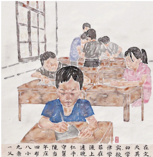
一九八四年,陳守仁遠渡菲律賓,白天在父亲小布庄当帮手,晚上在学校学英文。 华侨历史博物馆展出的《仁者恒强——陈守仁》 冯婧琦/连环画