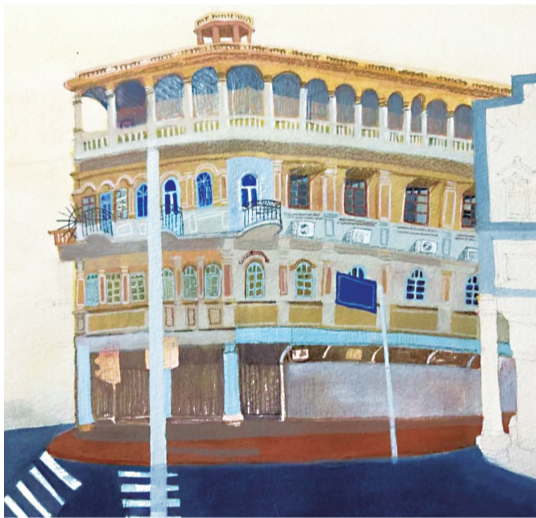
华侨历史博物馆展出的《李奶奶的守候》尚婕/连环画