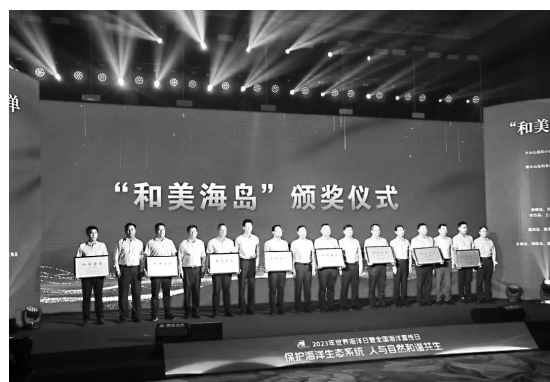
颁奖仪式现场 在碧海蓝天间感受人与自然和谐之美