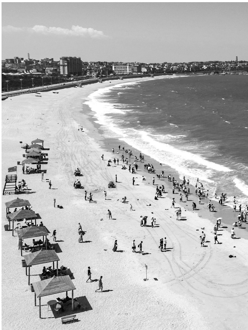
旖旎的滨海风光吸引了众多游客(陈斌)