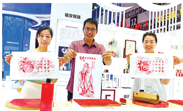
观众体验龙岩雕版印刷

两部主旋律影视剧开拍背后,是异军突起的福建影视产业——省内形成了各具特色、功能互补的厦