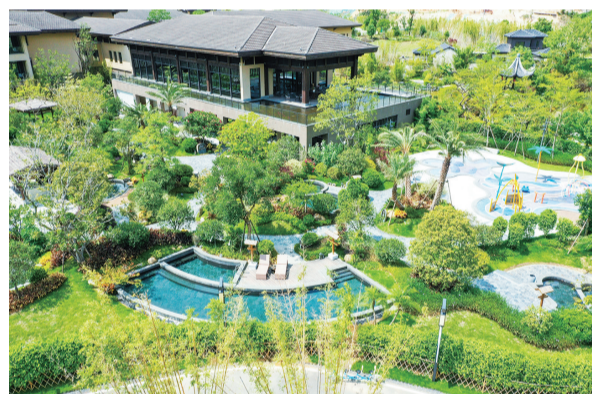
山水庭院式的福州永泰温泉

记者从福州市政府获悉,福州市近日制定《关于落实全域治水推进城区内河旅游及温泉旅游融合发展工作方案》(以下简称《方案》),以“把福州内河建成文明河、经济河、旅游河”为目标,到2025年底前,福州市内河旅游河湖水系开发总里程达102公里,“百里水上福道、千年闽都画卷”基本构建完成。