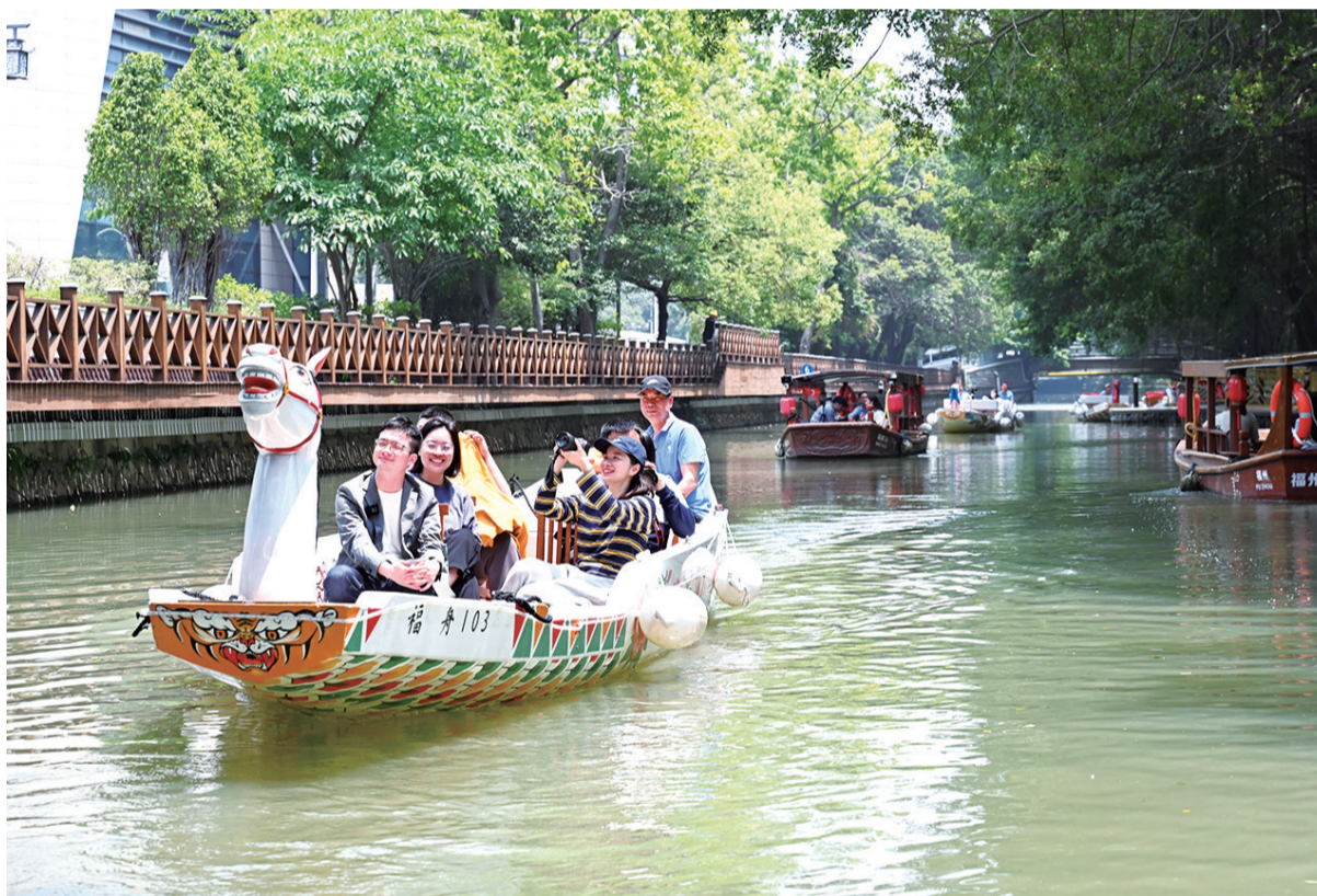
游客乘船游览福州东西河美景

2025年底前,再开发马杭洲河等7条河湖水系,新增可通航里程35公里,将晋安河—光明港内河旅游航线打造成国内标杆、国际领先的内河旅游精品线路,并最终形成以“山水城市游线”(温泉公园温泉博物馆—河口生态水系展示馆—光明港温泉水乐园—“3820”战略工程实施30周年成就展展馆)为代表的精品航线。