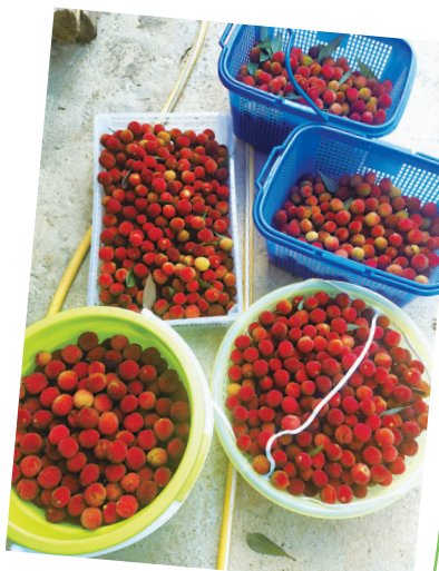
酸酸甜甜的杨梅是夏日里的快乐