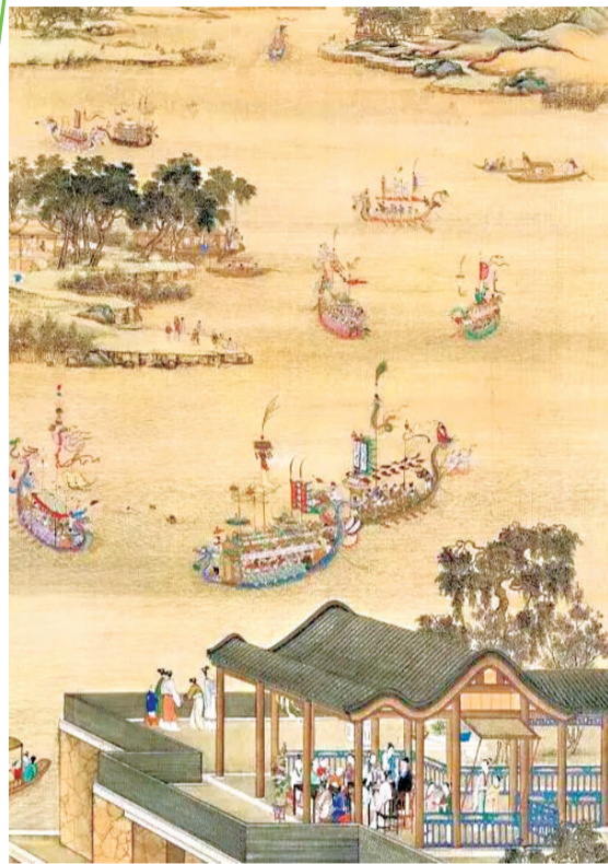
清朝宫廷画家郎世宁的《雍正十二月行乐图》(五月竞舟,局部),描绘了龙舟竞赛的情景 (故宫博物院藏)