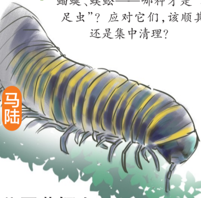
公园草坪上出现大量千足虫

昨日,记者来到旗山湖公园,发现在草坪里确实有黑色的千足虫爬来爬去。千足虫约长一寸,一些小朋友不时用脚去踩,不时听到父母亲的喊声,“不要用手去抓”。