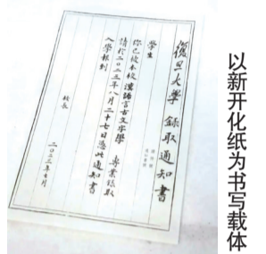
以新开化纸为书写载体