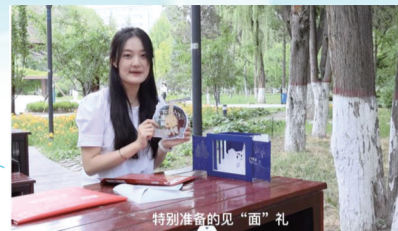
特别准的见“面”礼 兰州大学请你吃“牛肉面”

今年,兰州大学本科生、研究生录取通知书,均以三维立体的方式呈现,一共分三层,开门见山,缓缓推开,迎面而来。寓意敞开胸怀。第一层为校徽、校训石,第二层为兰州大学正门,第三层