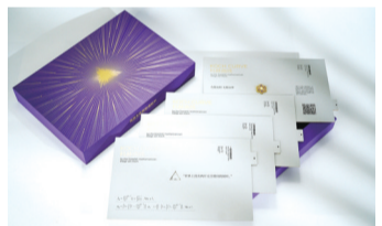
录取通知书表面细线呈放射状

“NJU Galaxy”。扫一扫雪花徽章右下方的二维码,输入学号,点亮自我,加入由13934颗本科生星球组成的“NJU Galaxy”。“一花独放不是春,百花齐放春满园。”个