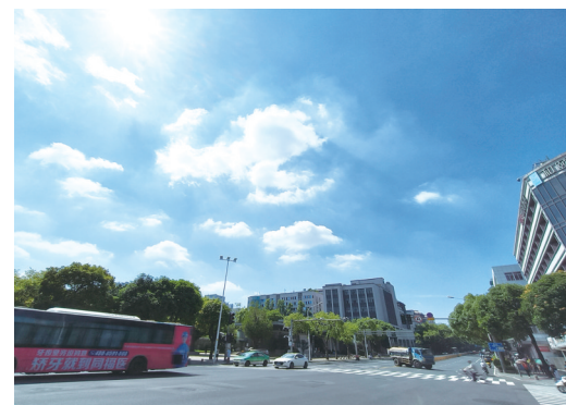
昨日,福州鼓屏路上艳阳高照

海都讯(记者 罗丹凌 梁展豪 文/图) 6月末,蝉声不绝于耳。正午发烫的光束,毫无顾忌地打在行人身上。走街串巷的风,绿了枝头,吹开繁花,却不给我们送来清凉。