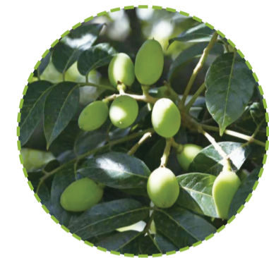
闽清橄榄

眼看到了炎热潮湿的三伏天,高卧于空调房中安享清凉的“宅宅”们迅速增多。夏日的空调房是滋生困顿因子的“温床”,椅子上一瘫,床上一躺,瞌睡虫就爬上了脑瓜。在提神醒脑方面,吃零食是个不错的选择,来一颗闽式蜜饯,小小的酸咸甜,在口中炸开短暂的提神瞬间。