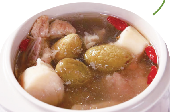
橄榄炖猪肉 (资料图)