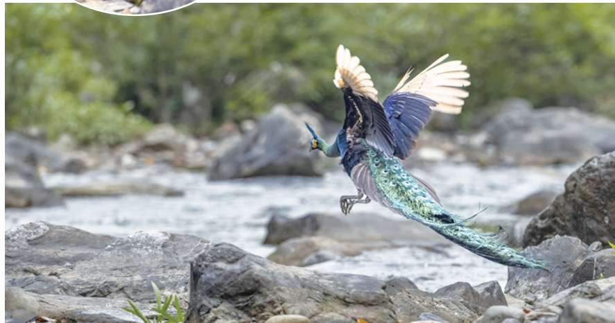
恐龙河自然保护区内的绿孔雀

那么，绿孔雀是什么样子的？蓝、绿孔雀究竟有何区别？绿孔雀的生活习性有哪些？在传统文化中绿孔雀又是以怎样的形象示人的？