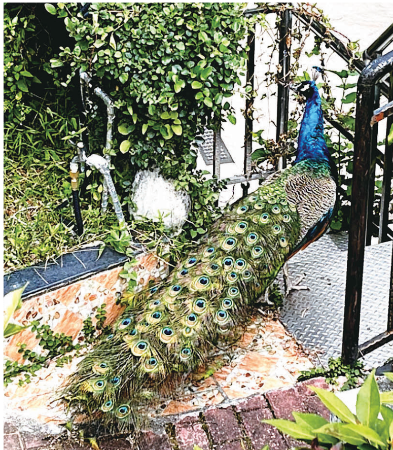
蓝孔雀在小区内漫步